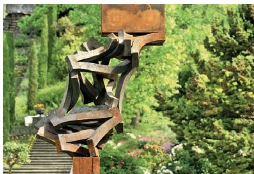
Die Stahlskulptur Drehung von Thomas Roethel aus Bad Windsheim

Anmeldungen nehmen das Diakonische Werk oder das Pfarramt St. Johannis entgegen. Der Teilnahmepreis beinhaltet immer die Fahrtkosten, Führungen und eventuell Eintrittspreise. Genaueres entnehmen Sie bitte dem Fahrtenprogramm „Unterwegs mit Kirche und Diakonie“. Das Programm liegt in allen Evangelischen Pfarrämtern, im Seniorenbüro und an vielen weiteren Orten aus. Weitere Infos und Auskünfte erhalten Sie bei dem Diakonischen Werk, Tel. 09721 2087-102 oder im Pfarramt St. Johannis, Tel. 09721 53315210.