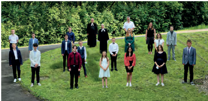
Die Konfirmierten des Jahrgangs 2020/21.